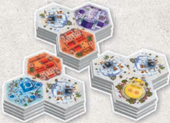
61 tuiles Cité