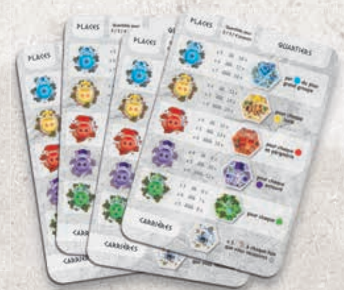
4 aides de jeu