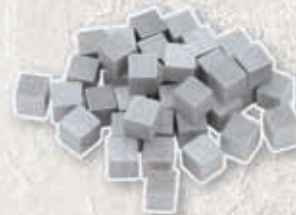
40 cubes Pierre