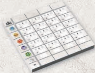
1 bloc de score