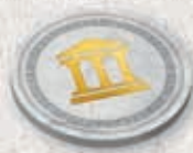
Pion Architecte en Chef