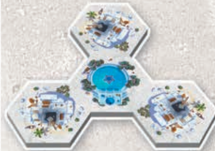
4 tuiles de départ