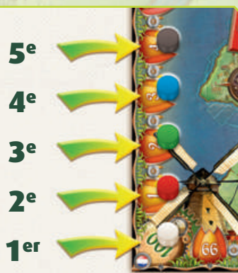
Position de départ des joueurs

Chaque joueur après le premier commence la partie un cran plus loin que le joueur précédent sur la piste des scores. Ceci compense le léger avantage des premiers joueurs.