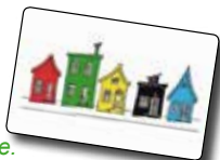
Fig.1 : exemple de disposition horizontale.