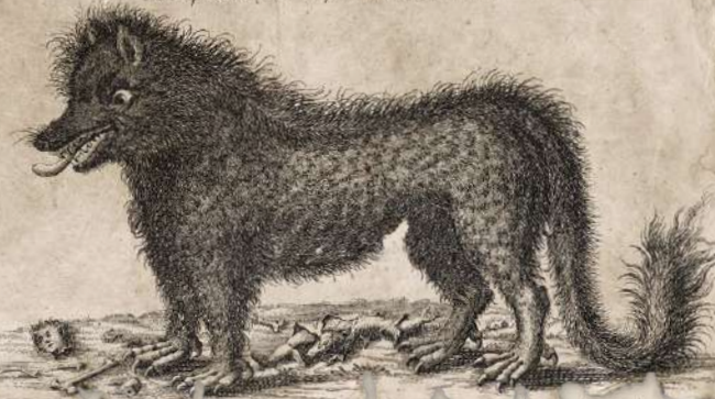
Figure du Menstre, qui desle le Gervaudon. Celle Bête est de la taille d'un jeune Fauveau elle attaque de preference les Femmes, et les Enfants elle boit leur sang, leur coupe la tête et l'emporte. Il est promis 2700 l à qui tuera cet animal.

JOUER UN JETON TRACES FACE VISIBLE (côté identité) indique aux Enquêteurs sous quelle identité vous agissez. En contrepartie, vous bénéficiez du pouvoir de cette identité (voir page suivante).